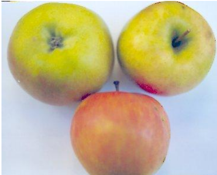
Fruit d'un grand verger professionnel de Touraine.